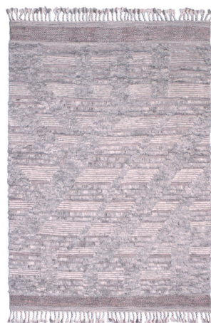
DUN 6096 Rosa/Grigio