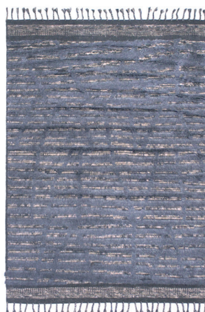
DUN 6080 Blu Notte