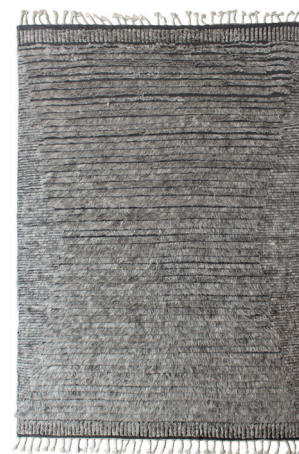
DUN 6201 Grigio/Talpa

I dati forniti in questa scheda tecnica sono aggiornati al momento della pubblicazione. Carpet Edition si riserva il diritto di modificare materiali, dimensioni e caratteristiche senza preavviso. The data provided in these technical specifications are up to date at the time of publication. Carpet Edition reserves the right to modify materials, sizes and characteristics without notice.